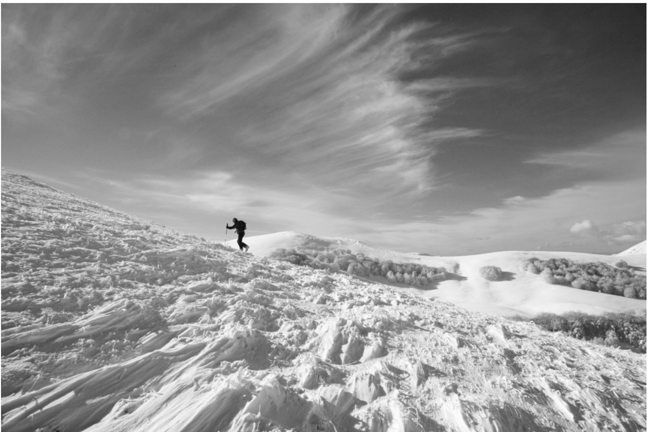
U - Sci alpinismo sui Monti Sibillini