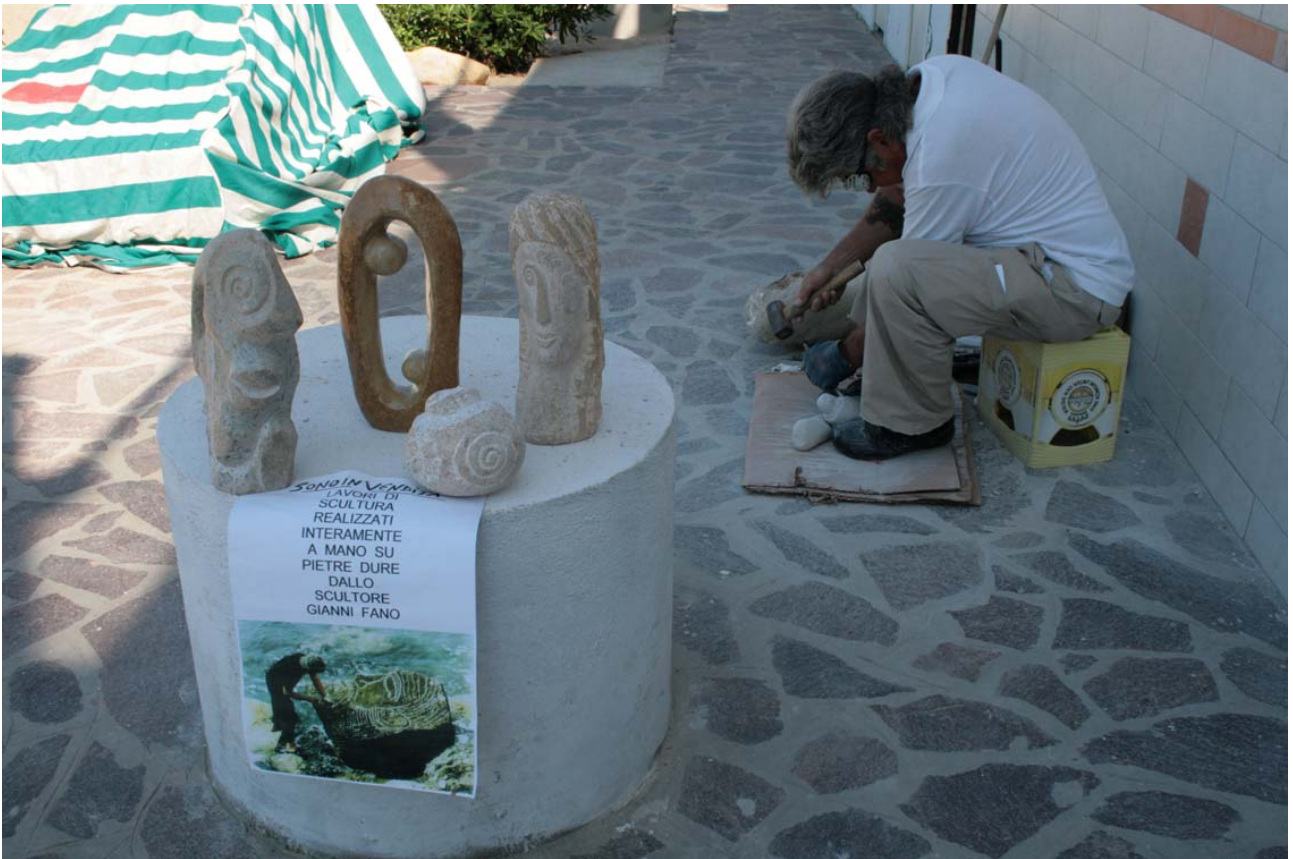
T - Plasmare la pietra