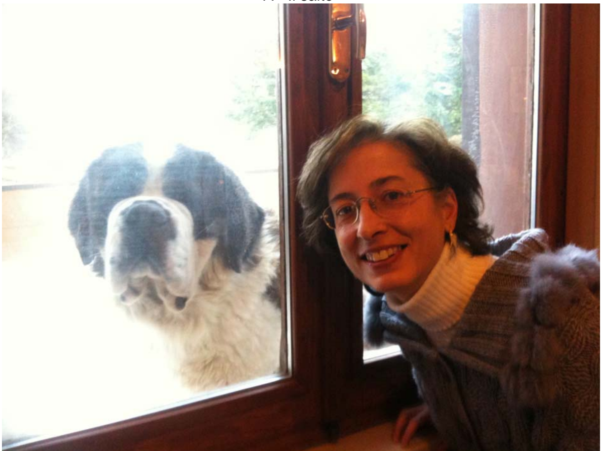
A - Sguardi