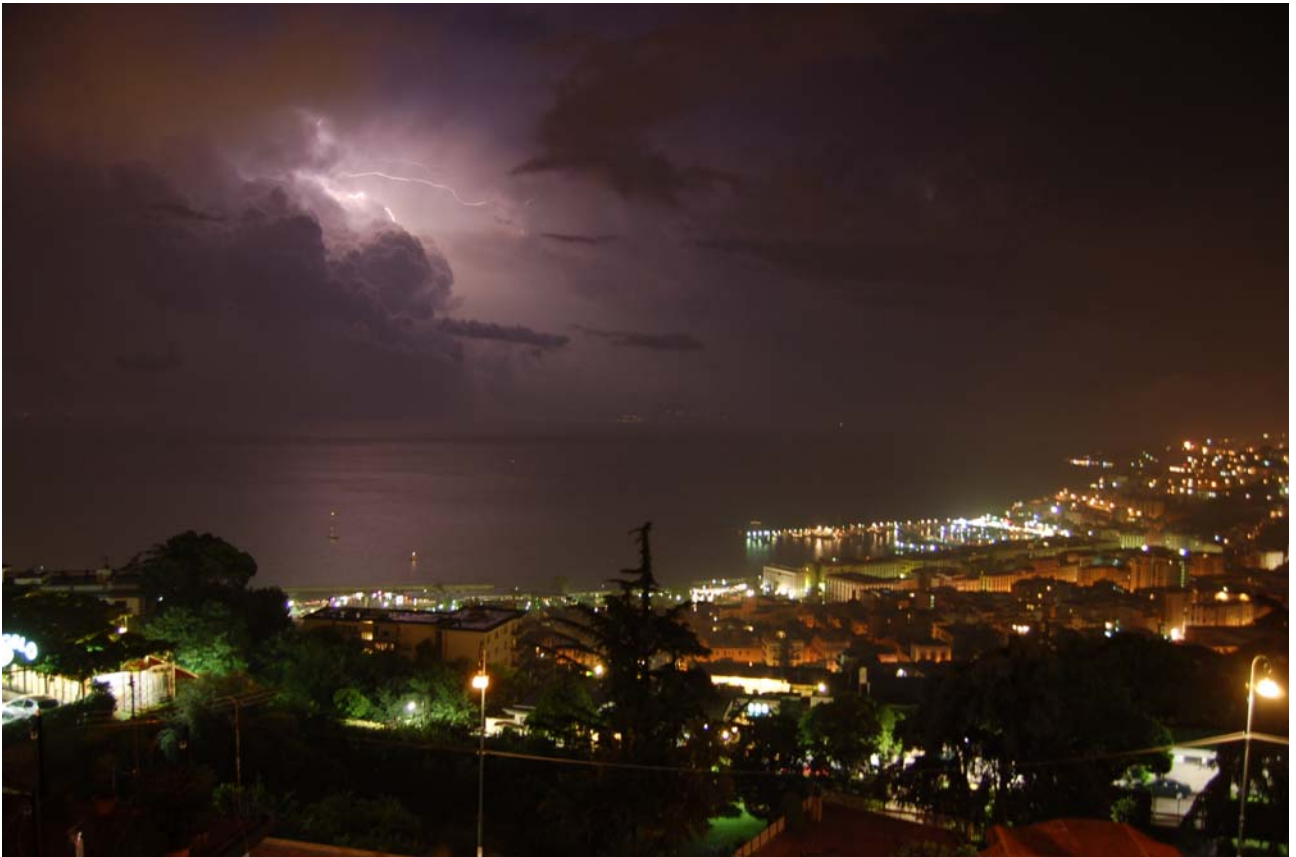
P - La notte