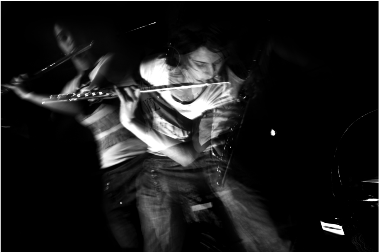
I - Tra le righe delle note