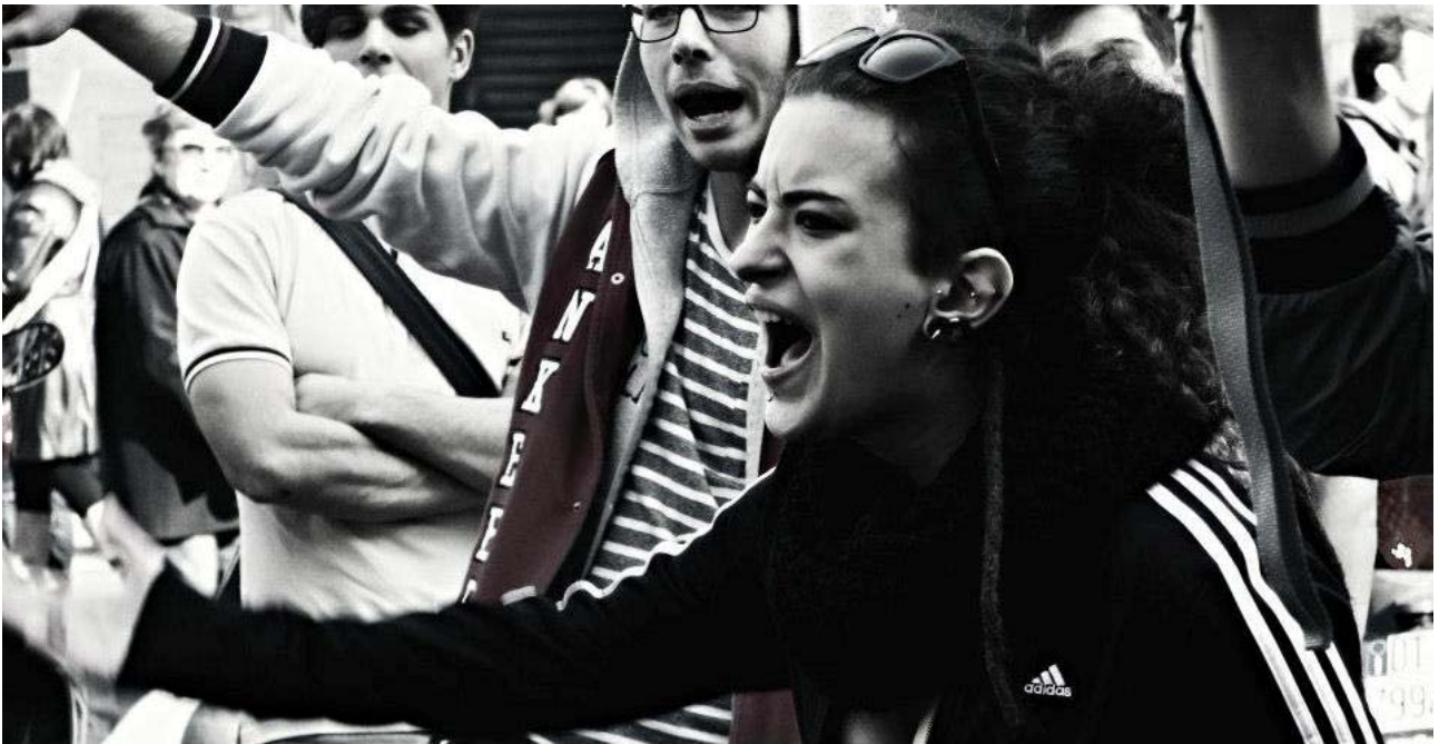
G - La voce della rivoluzione