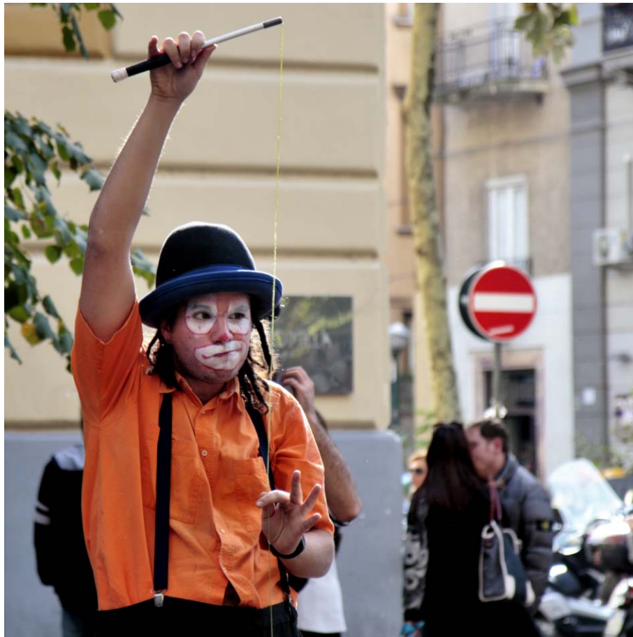
F - Concentrazione massima