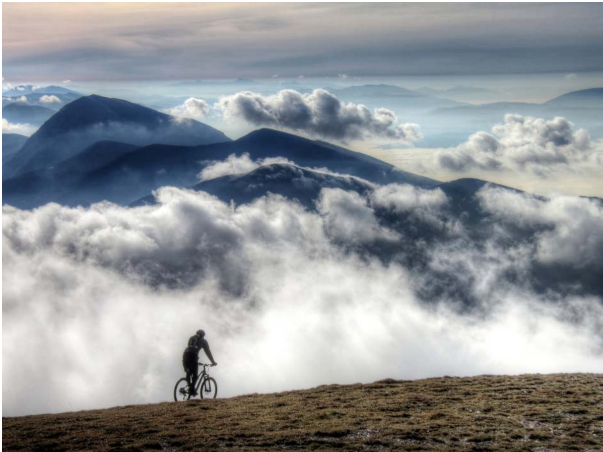
U - Mountain bike al Monte Catria