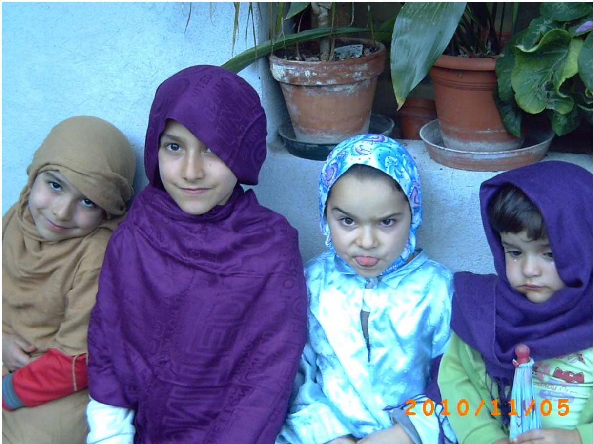
B - Quattro viandanti