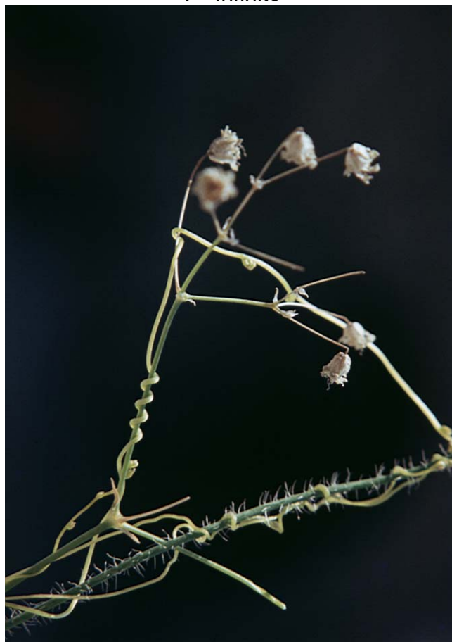
V - Senza te non posso vivere