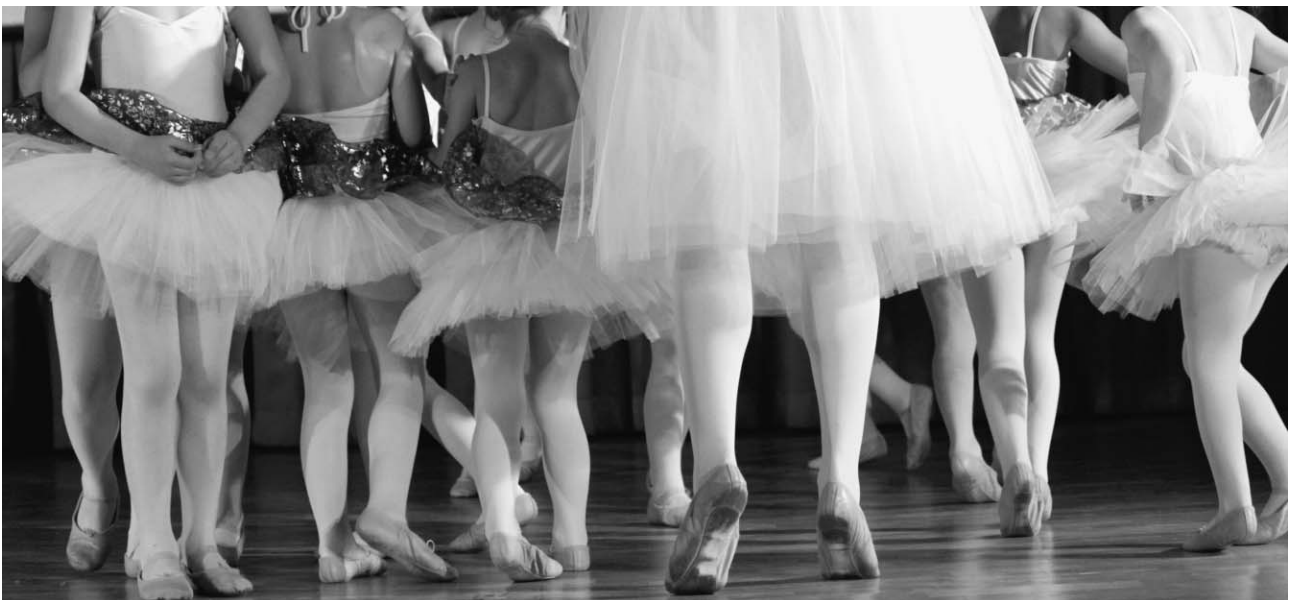
I - Una passione danzante