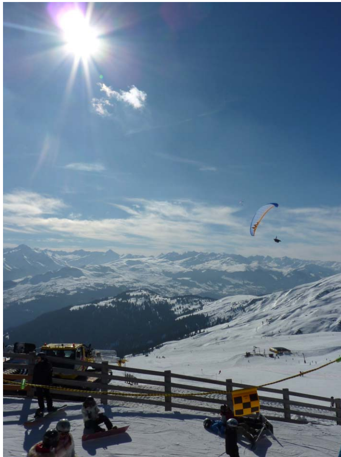
V - Infinito