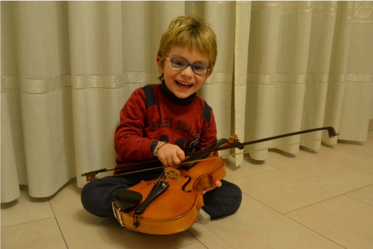
O - Ritmo