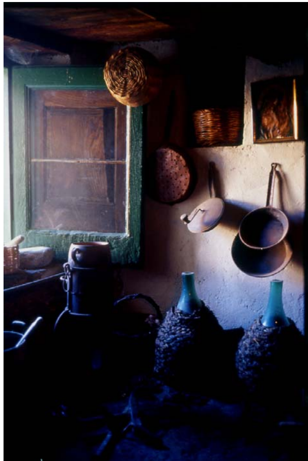
Z - La passione nel quotidiano