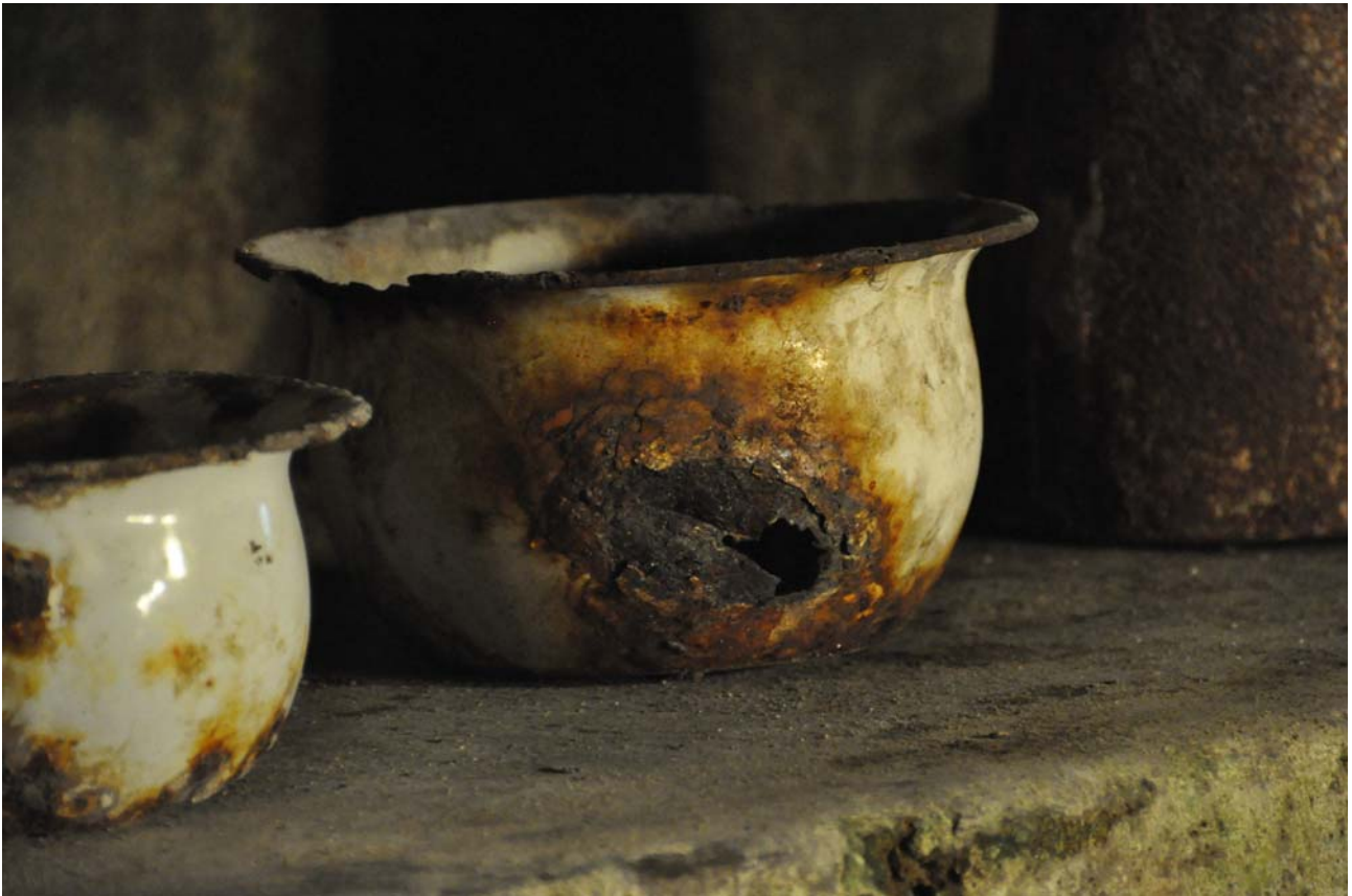
Q - Il sottosuolo