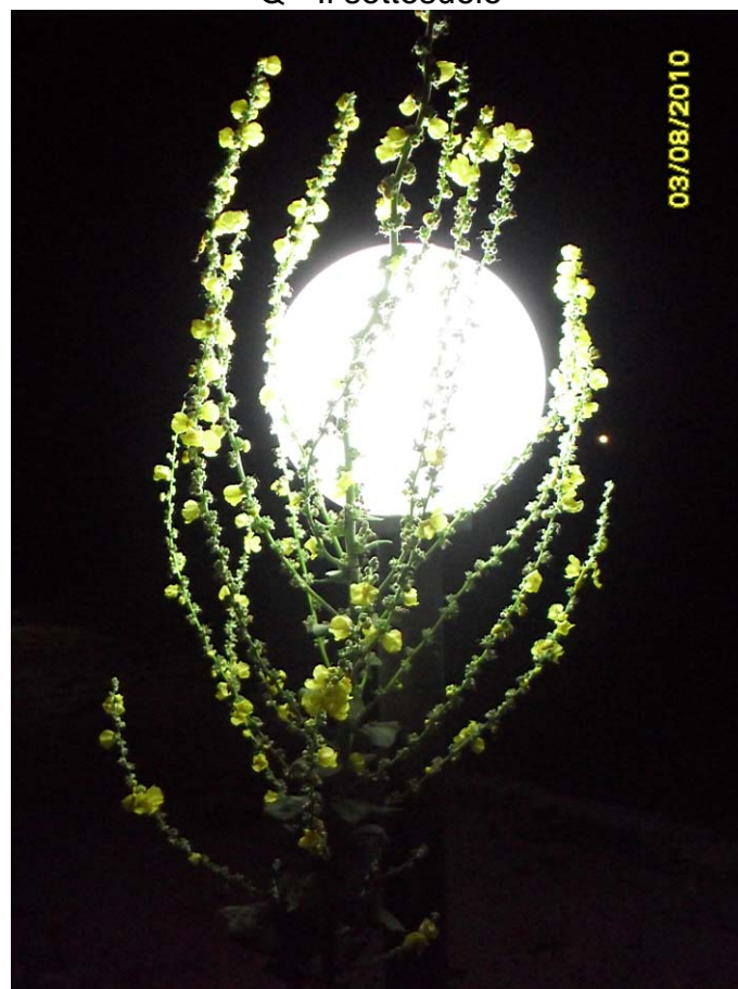
R - La luce della speranza