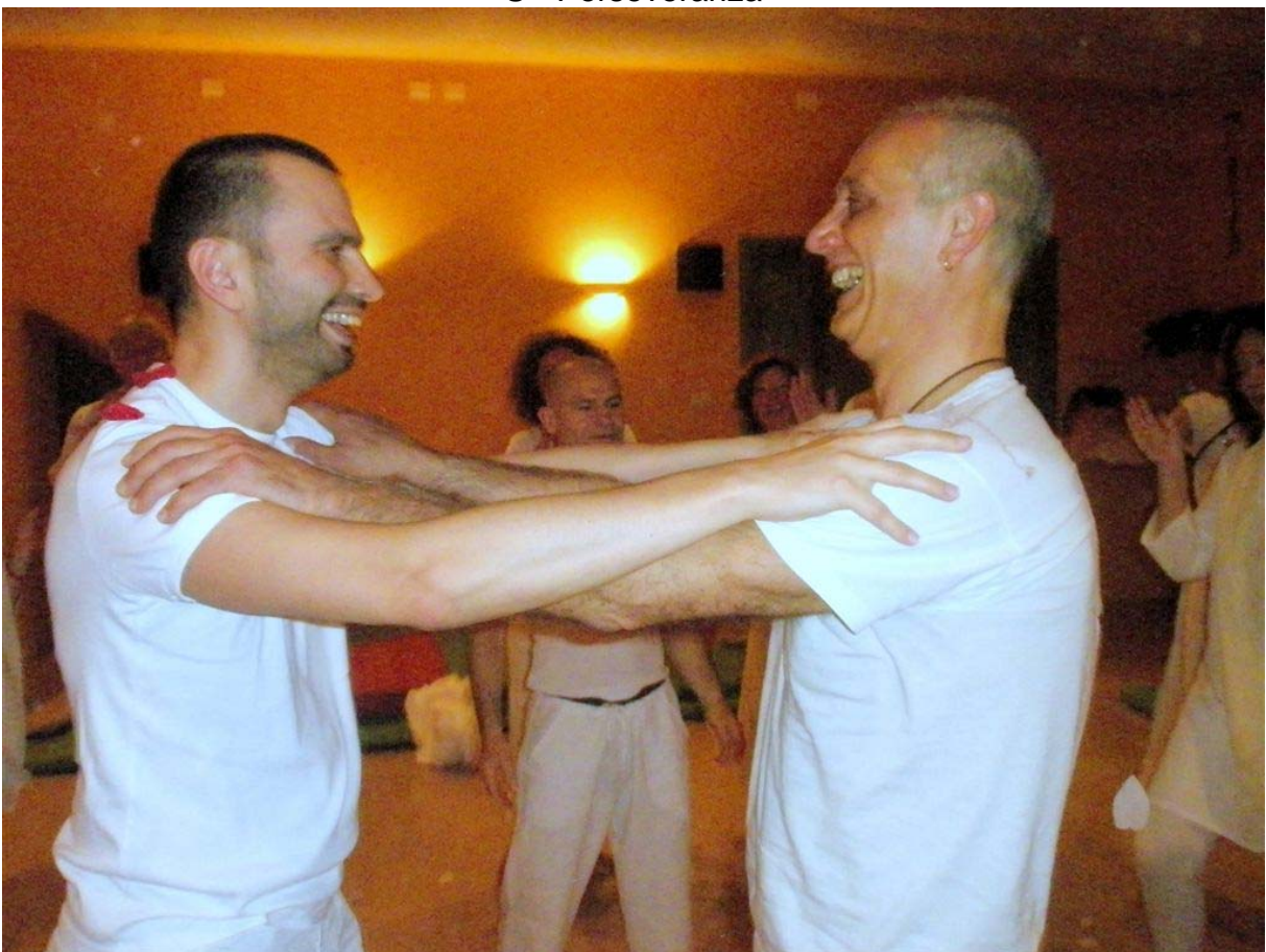
S - Amicizia