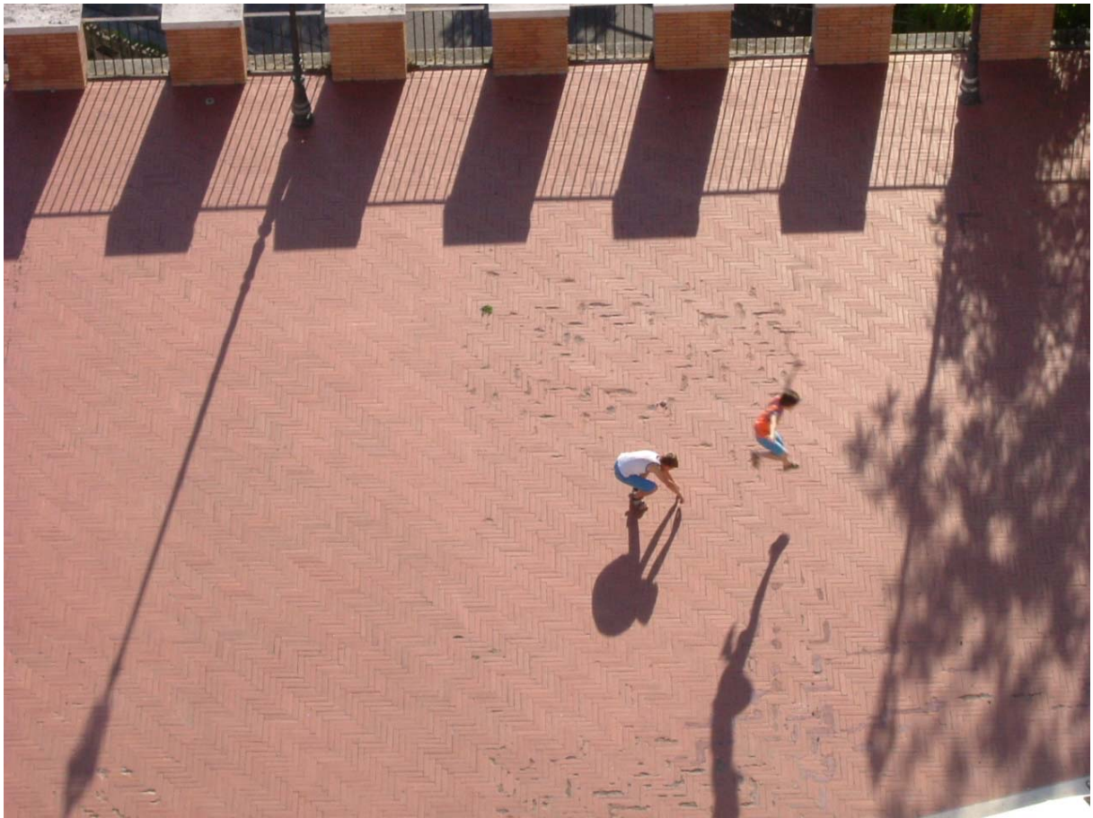
A - Il salto