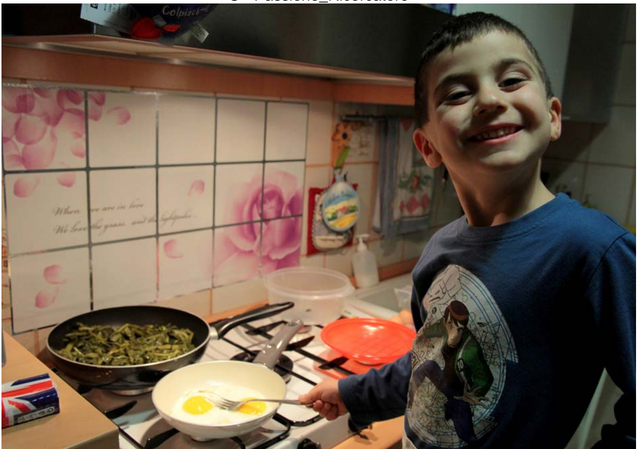
E - Cosa vuoi mangiare stasera