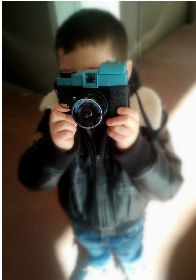
E - Dimmi Cheese