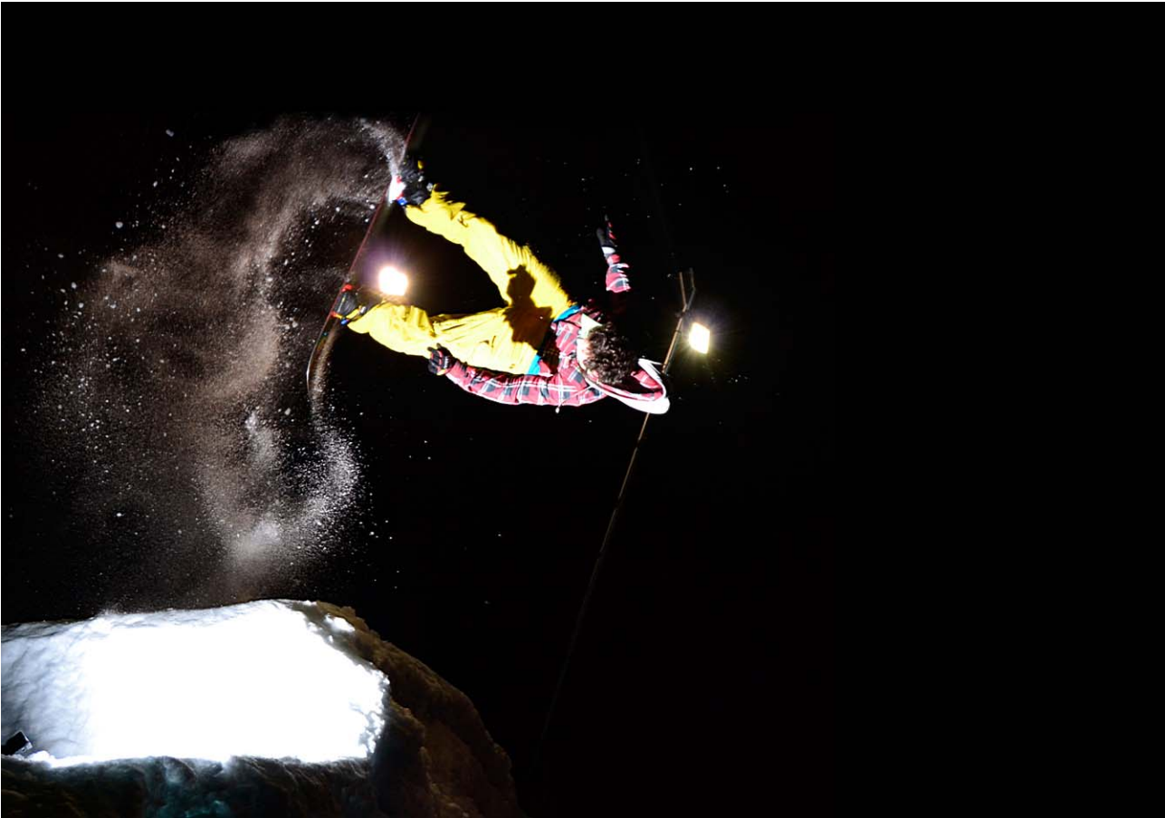
M - Polvere