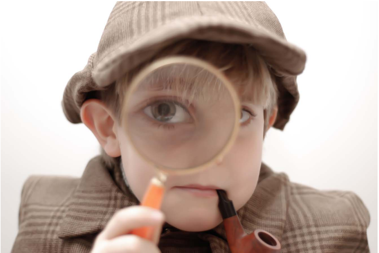
C - Passione_Ricercatore