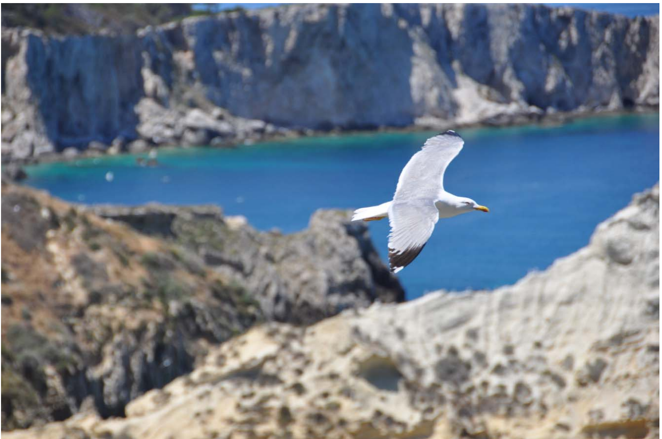
P - La libertà