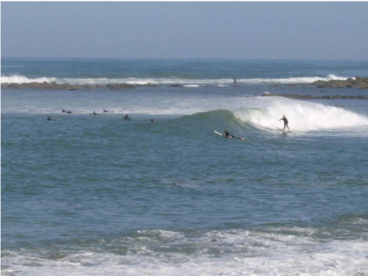
S - Perseveranza