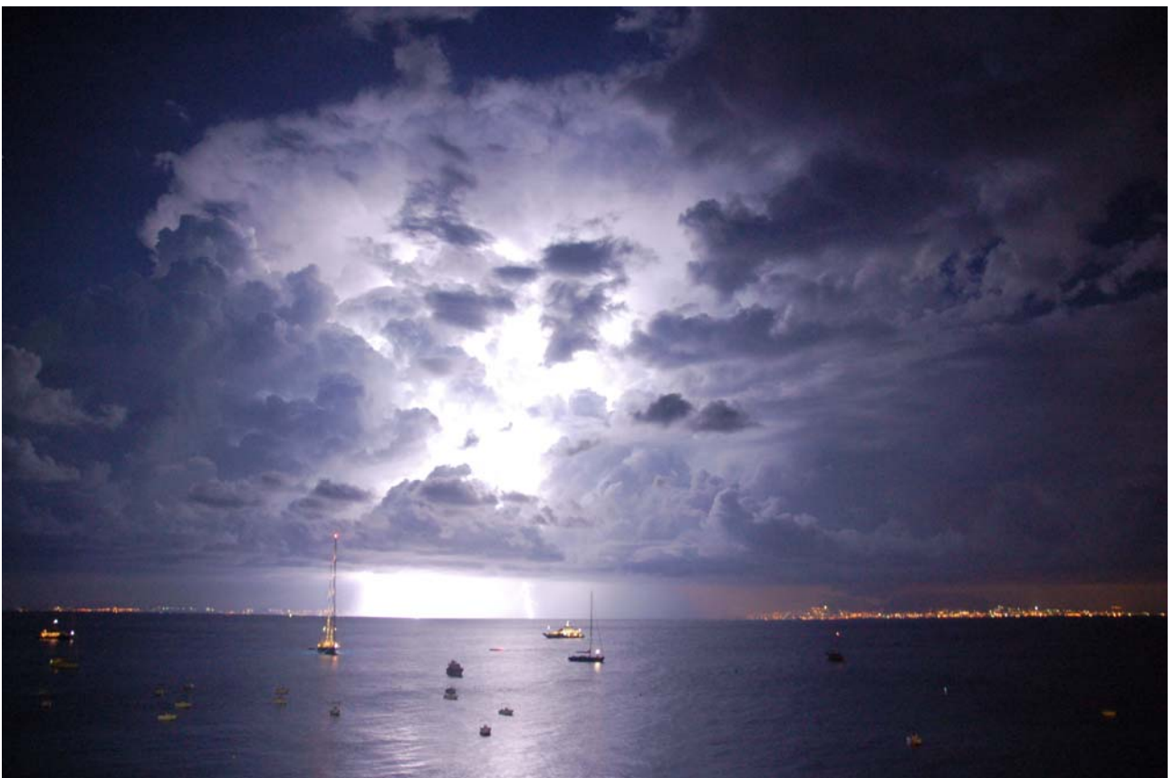
Q - Il mare