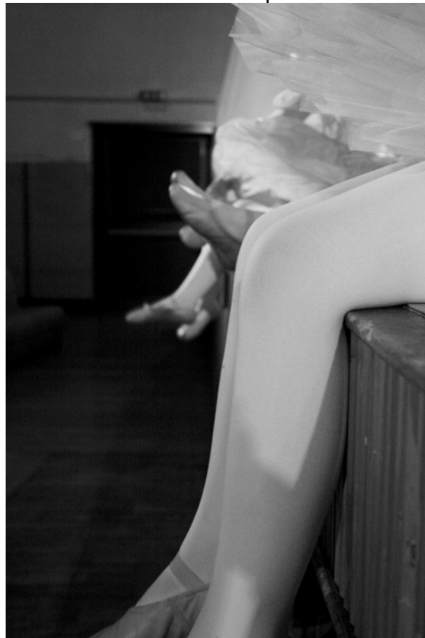
L - Primi passi