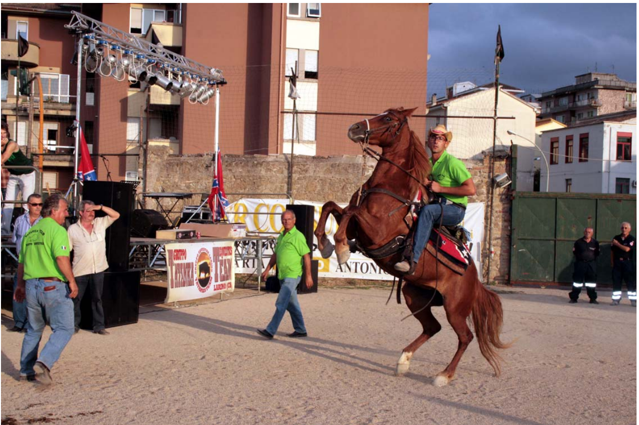
T - Un cavallo per amico