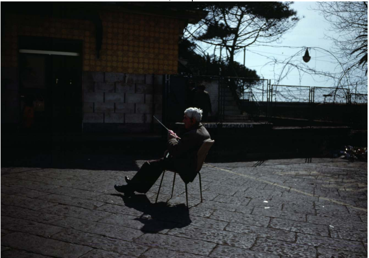
X - Una domenica pomeriggio