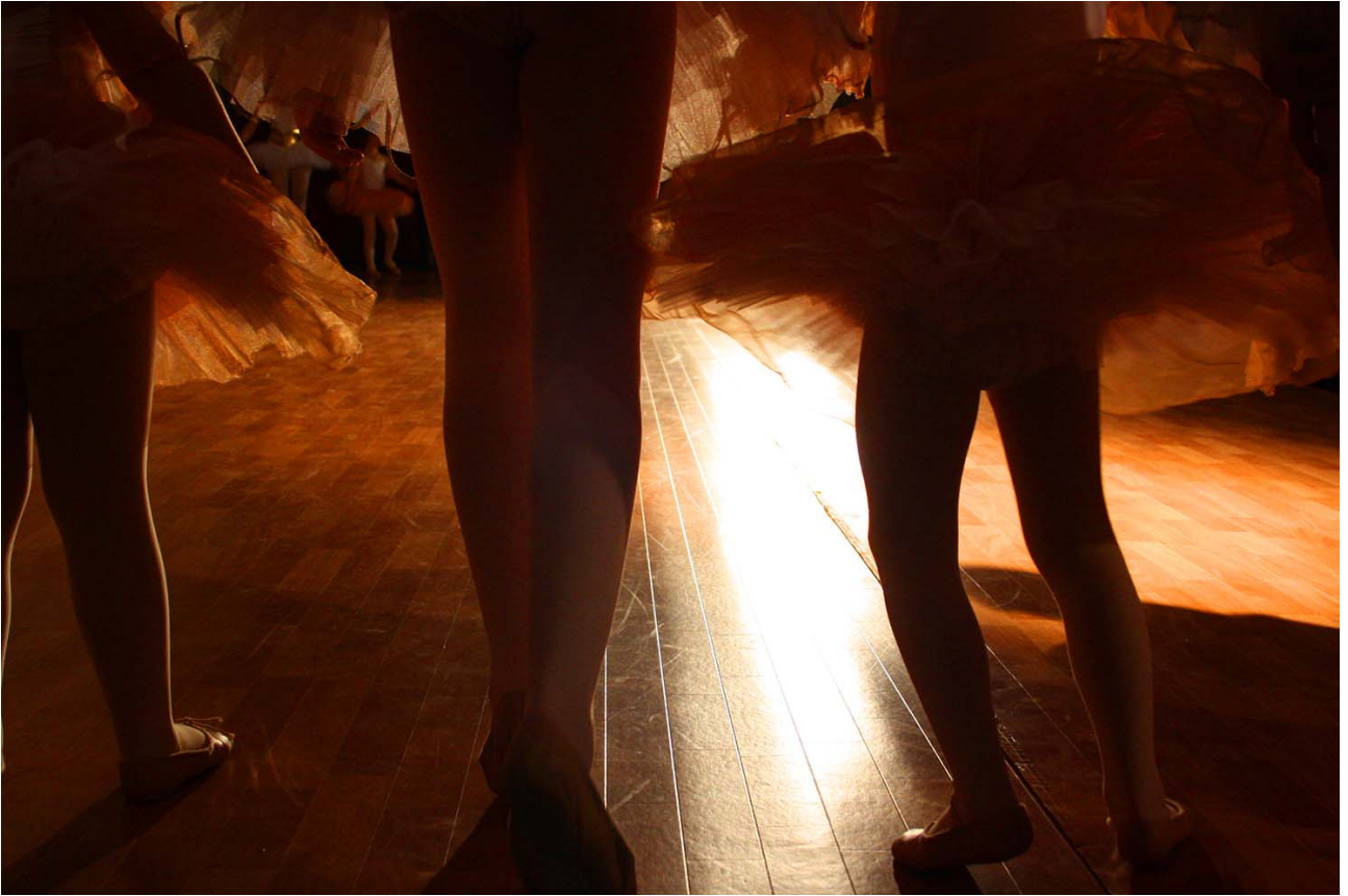
L - Giusto due passi