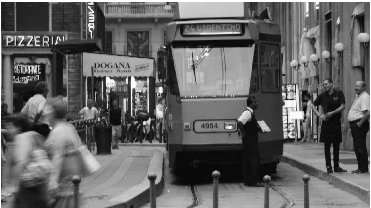
G - Il tram tram di Milano