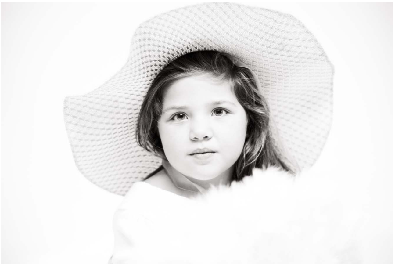
C - Passione_Modella