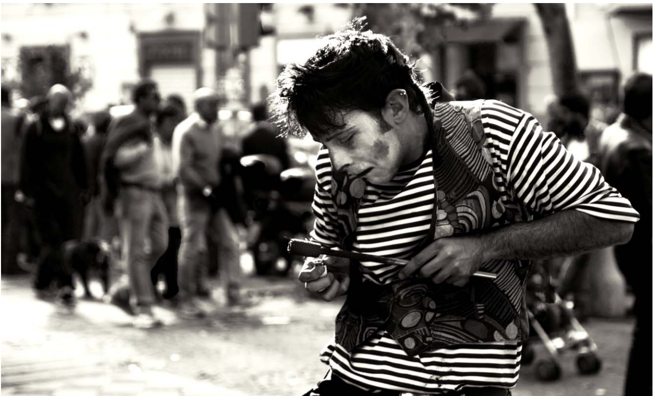
F - Accendiamo le nostre passioni